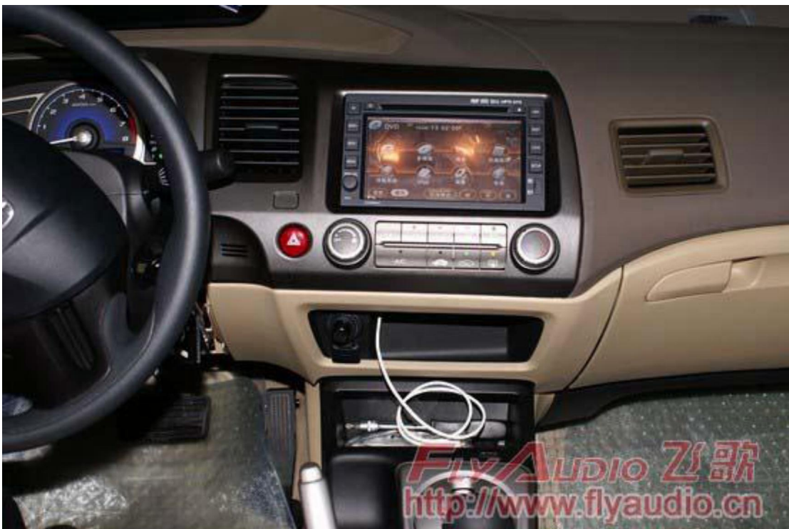
39. Установка завершена, ниже показана машина после установки нашего устройства