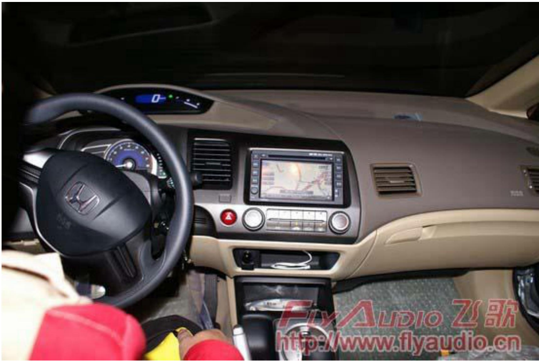
38. Белый кабель – соединение iPod