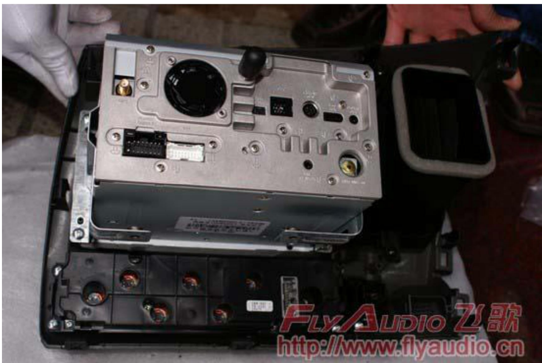
31. Правильно расположите GPS антенну.