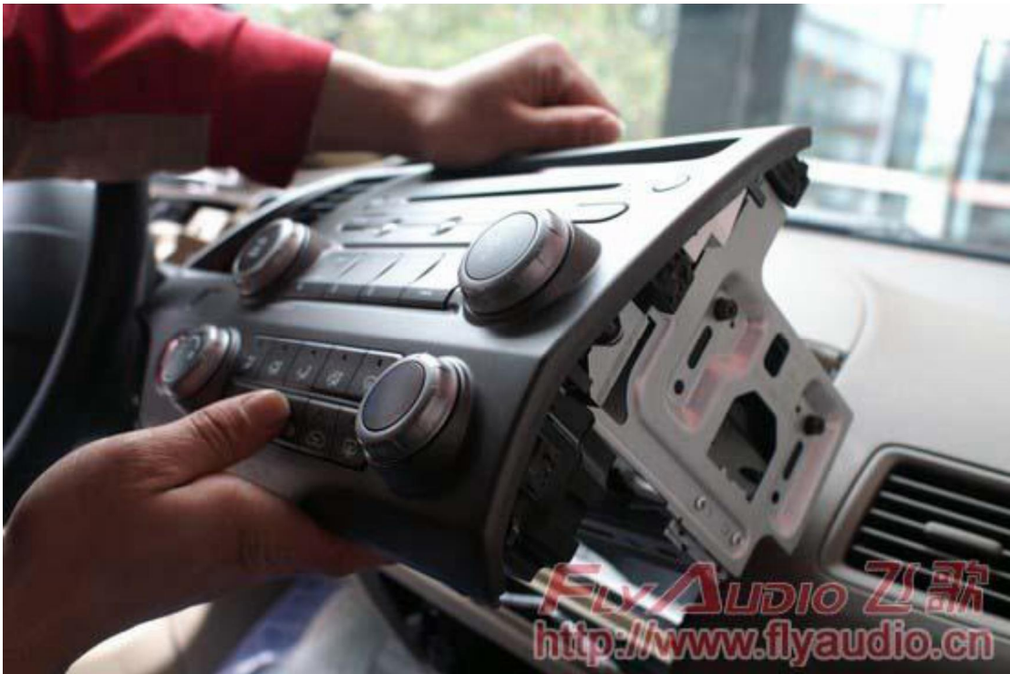
16. Так выглядит родная система сзади.