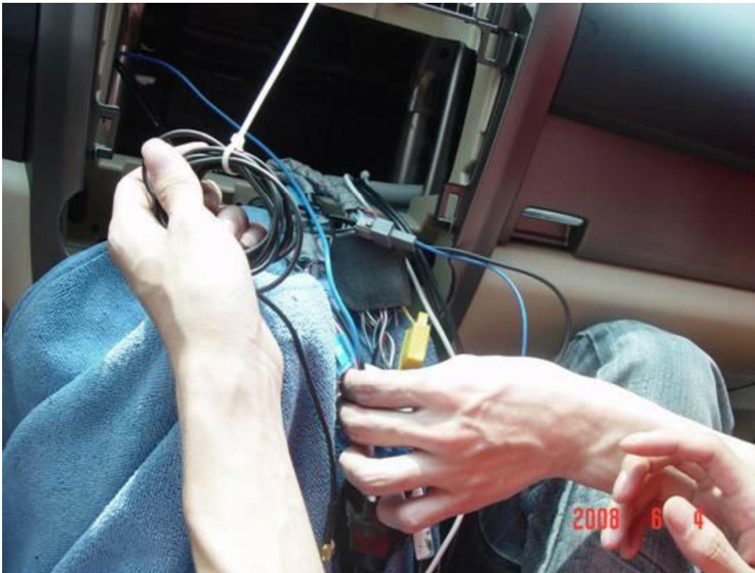
14. Вид после соединения кабелей.