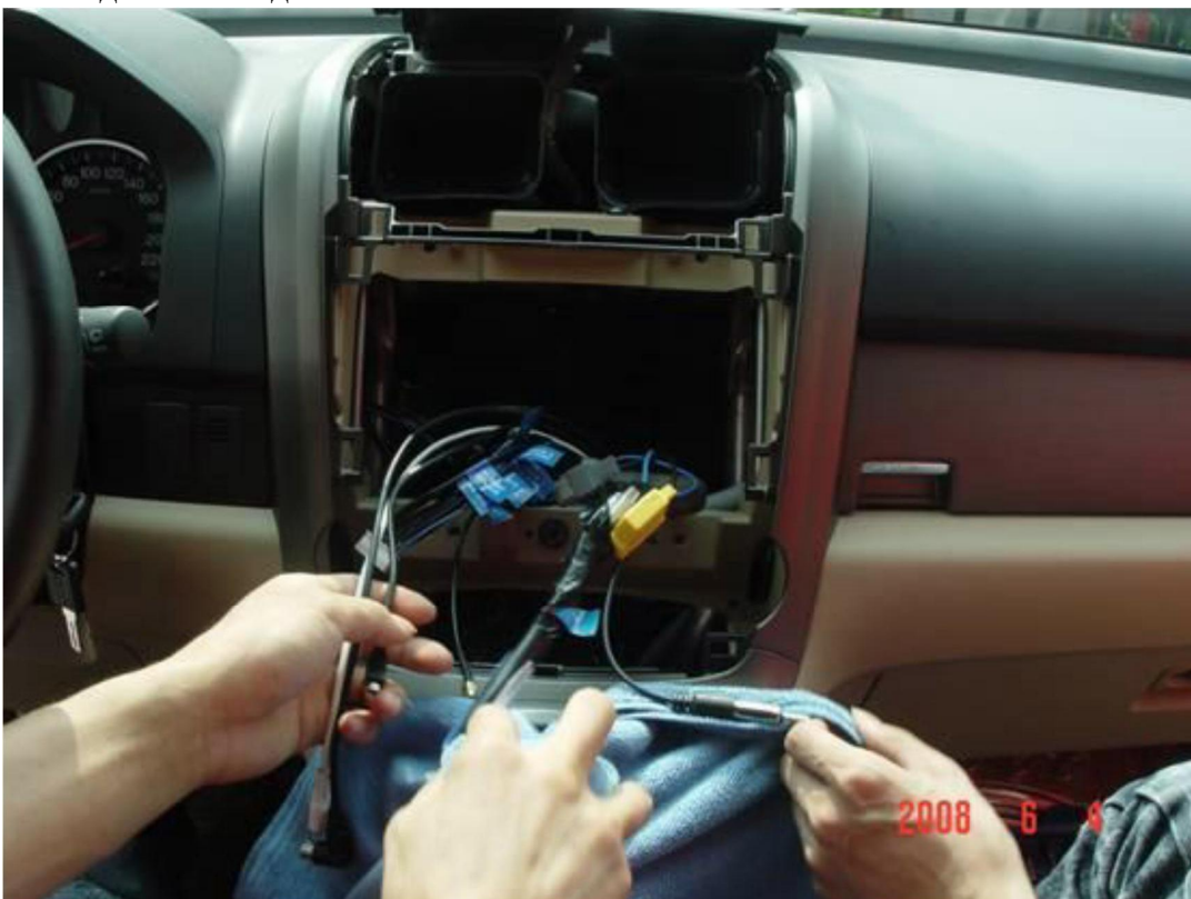
15. Прикрепите специальный крепеж к устройству Fly Audio.