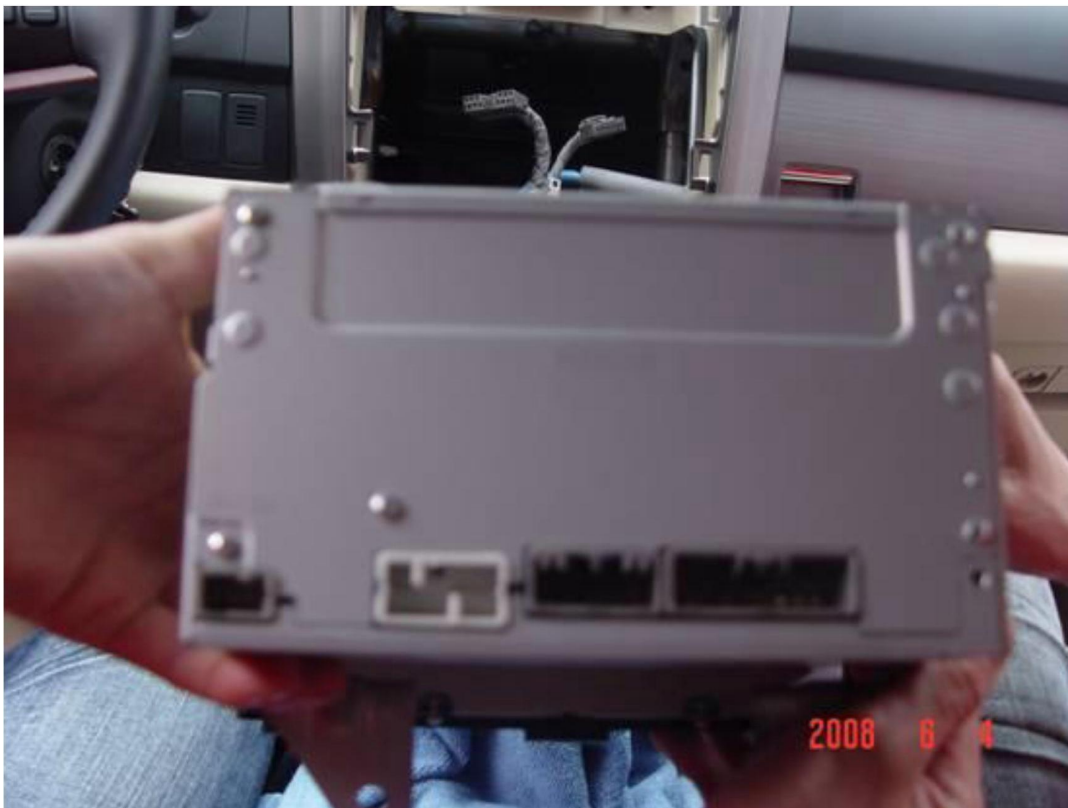
12. Вид после снятия родной магнитолы.