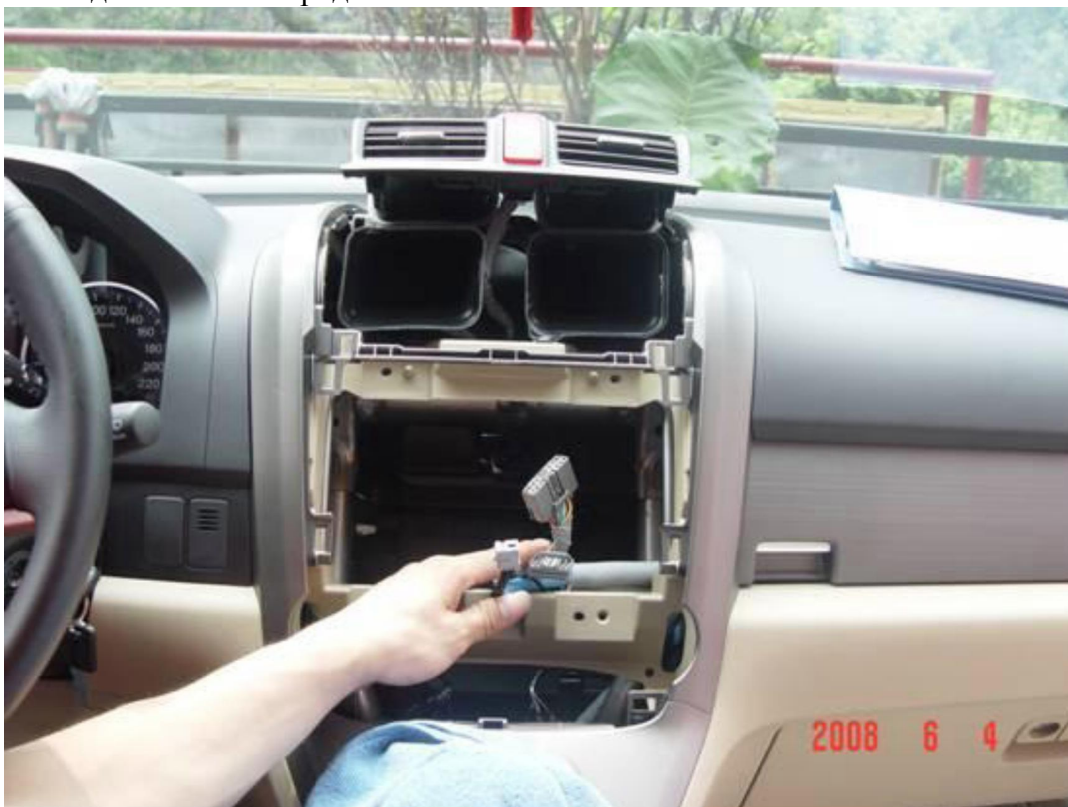
13. Стандартные кабеля Fly Audio

Компания FlyAudio Украина, Киев, ул. Степана Олейника, 21 Тел.: (044) 221-00-05, 221-00-04, 221-00-09, 573-90-30 http://www.flyaudio.com.ua/